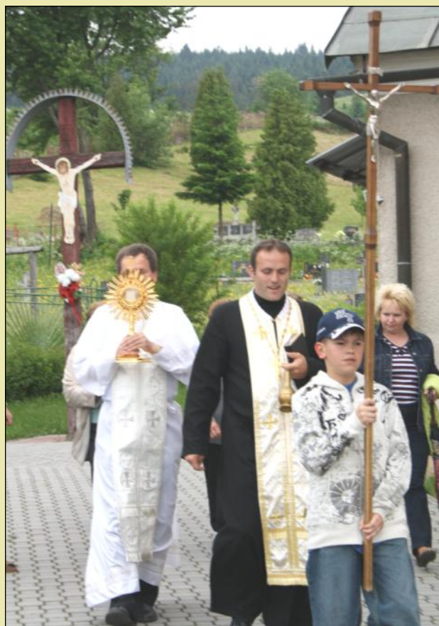
Procesia z Litmanovského chrámu

na Hore Zvir na znak vďaky v procesii s eucharistickým Kristom v nedeľu doobeda 13. 6. 2010. Otec Janičko posvätil počas putovania obnovený kríž.