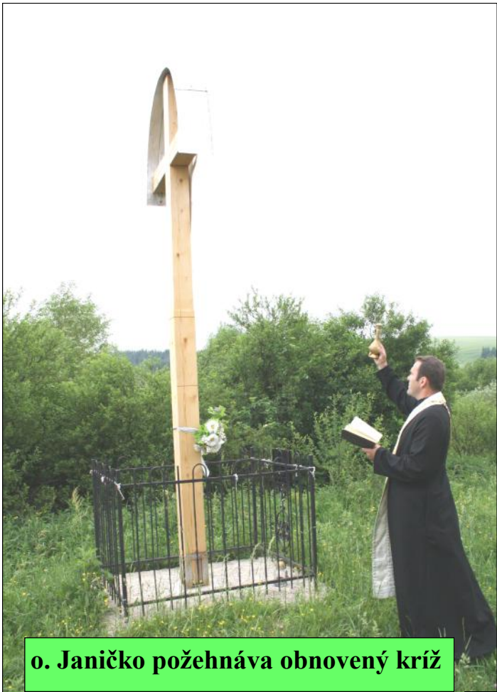
o. Janičko požehnáva obnovený kríž