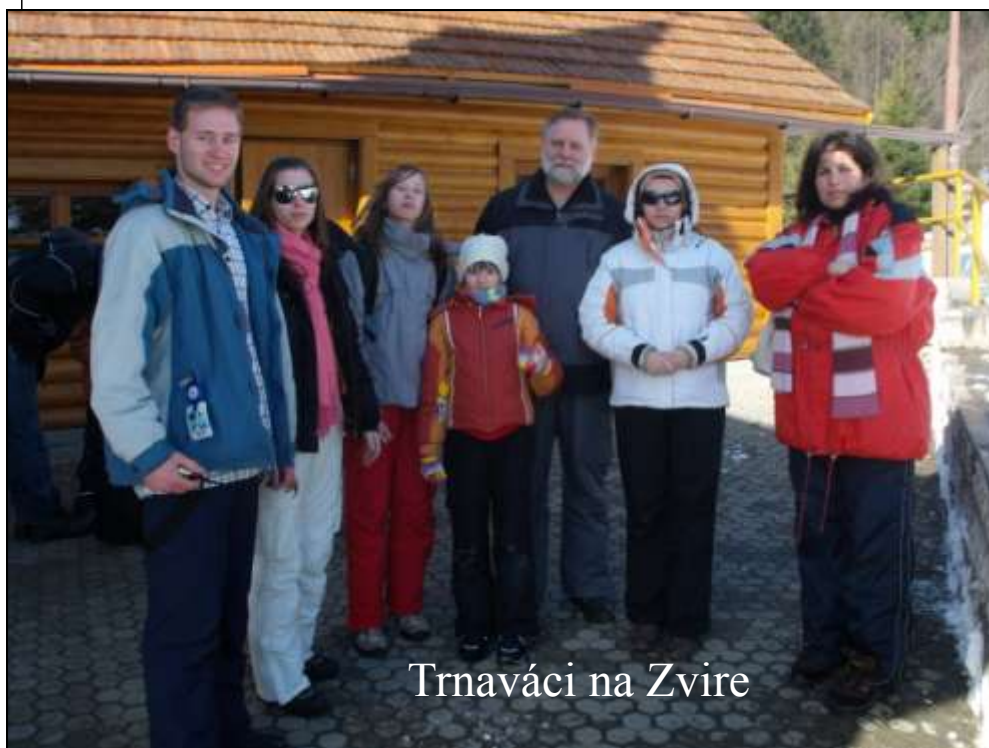
Trnaváci na Zvire

Mnohí využili jarné prázdniny na pobyt v Litmanovej. Zvládali lyžovanie aj duchovné pookriatie na Zvire.