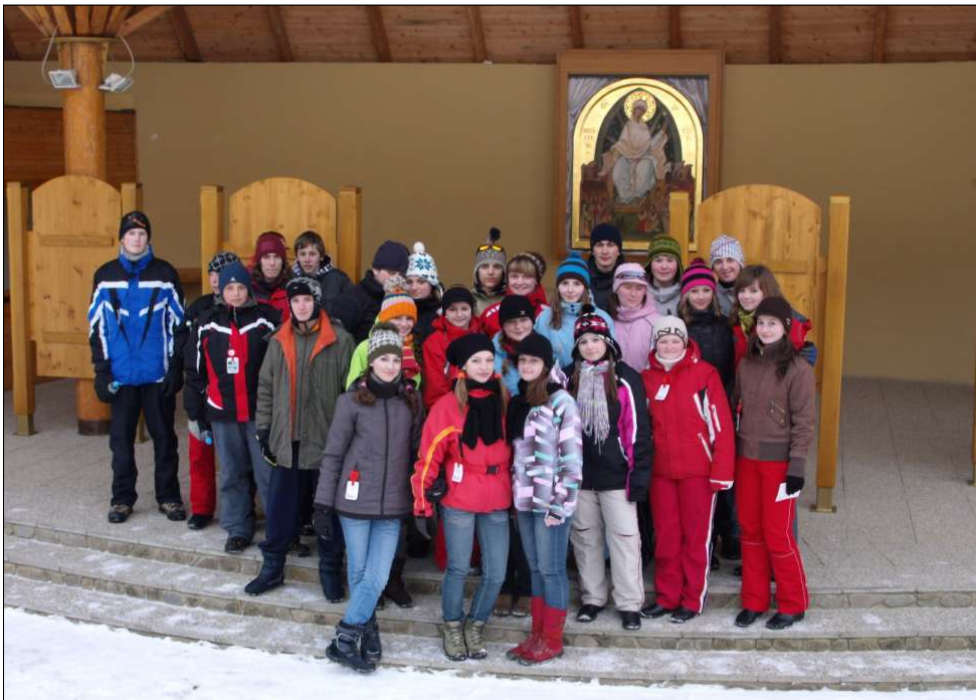
Študenti Gymnázia v Lipanoch na Zvire, v čase voľna v rámci lyžiarskeho výcviku.